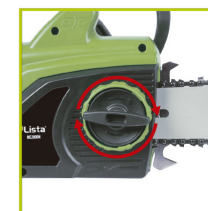
TENSOR DE CADENA SIN HERRAMIENTAS