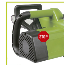
FRENO ELÉCTRICO DE CADENA