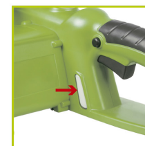
INDICADOR DE NIVEL DE ACEITE