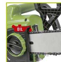
LUBRICACIÓN DE CADENA AUTOMÁTICA